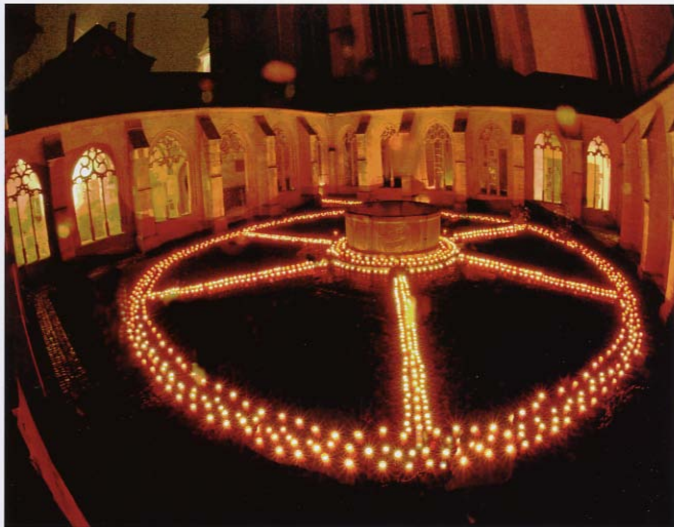
Aureusnacht: Über 2500 Grablichter leuchten den Verstorbenen; hier im Kreuzgang von St. Stephan, danach auf dem Leichhof, einem Marktplatz am Dom