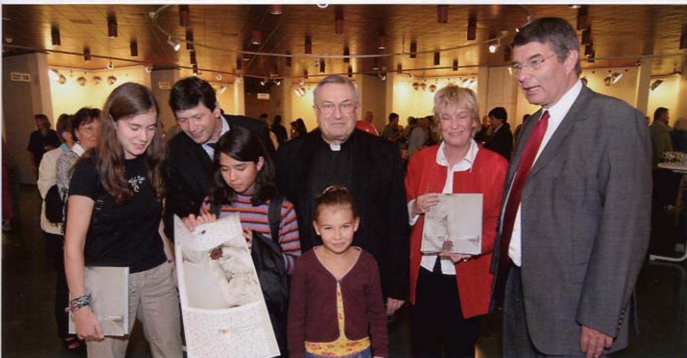
Der Autor mit Kardinal Lehmann und dem Bürgermeister der Stadt Mainz bei der Buchpräsentation im Ratssaal der Stadt Mainz

zeigt, was Licht nicht kann – aber ohne Licht kein Schatten. Beide Aussagen bilden die Botschaft. So lässt das Leben sich in seiner Vollkommenheit letztlich nur durch den Tod verstehen. Ohne Spiegelung seiner Gegensätzlichkeit wird Umschreibung von Tod als „kein Leben“ zum End- und Schlusspunkt des Lebens – spiegelt nicht mehr das Leben, nimmt uns den Blick für das Leben. Wer daher den Tod verdrängt, verdrängt das Leben. Nicht verdrängen, sondern den Tod annehmen, ihn in seiner Botschaft verstehen, ihn ins Leben einbeziehen, die stete Gratwanderung in uns richtig entscheiden und Tod in Leben wandeln. So bietet der Tod auch die Chance, das Leben aus einer anderen Perspektive zu sehen. Schauen wir vom Ende in dieses Leben, so erkennen wir dreierlei: